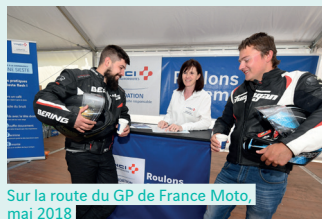
Sur la route du GP de France Moto, mai 2018

La Fondation est présente sur la route des grands événements sportifs (24 Heures du Mans Motos, GP de France Moto, GP d'Espagne, Bol d'Or...) pour sensibiliser le plus grand nombre de motards. Grâce aux « Relais motos », elle les incite à faire des pauses.