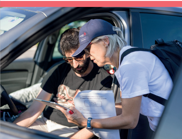
Enquête et prélèvement de salive Aire de Saint-Rambert-d'Albon (A7), Juin 2018