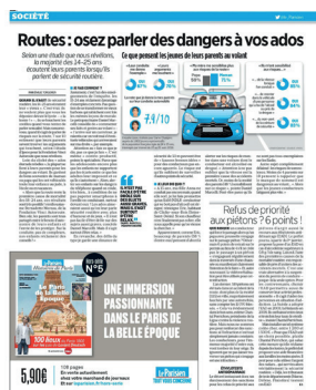
Le Parisien (19/09/18)

Des chercheurs de l'INSERM, des Hospices civils de Lyon et du Centre de recherches en neurosciences de Lyon ont invité des automobilistes à participer à des tests d'attention et à donner deux échantillons salivaires dans le cadre d'une étude financée par la Fondation d'entreprise VINCI Autoroutes. Cette étude est destinée à mesurer les biomarqueurs de la privation de sommeil et du stress auprès d'un large public de conducteurs.