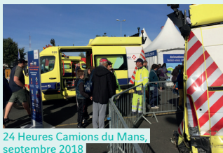
24 Heures Camions du Mans, septembre 2018

Au Mans, lors des 24 Heures Camions, ou au Castellet, lors du GP Camion, la Fondation a notamment sensibilisé les chauffeurs routiers aux risques spécifiques de leur métier, en insistant notamment sur la nécessité de veiller à la sécurité du personnel intervenant sur l'autoroute.